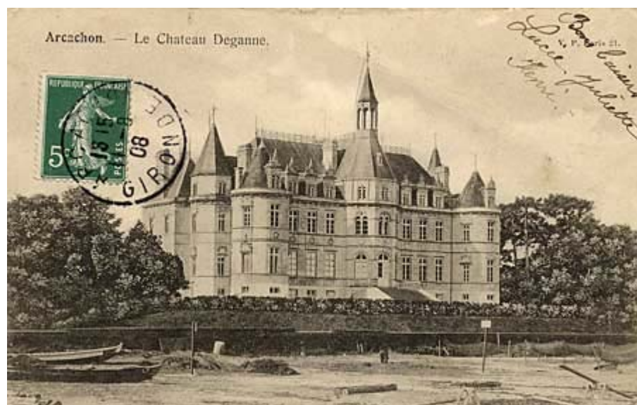
Une carte de F.A. & Cie faussement localisée au Havre

Il semble bien que l'ensemble de la première série de cartes éditées par V. Porcher (celles dont la numérotation va de 570 à 578) aurait fait l'objet d'un tirage antérieur, toujours sous la forme de cartes nuages, chez l'éditeur FA & Cie. Un éditeur dont nous ne savons rien sinon qu'il avait un catalogue qui couvrait une partie de la France et même de l'Algérie et qu'il lui arrivait de mélanger les localisations.