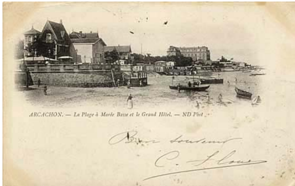
Type 3 : type 2 en couleur