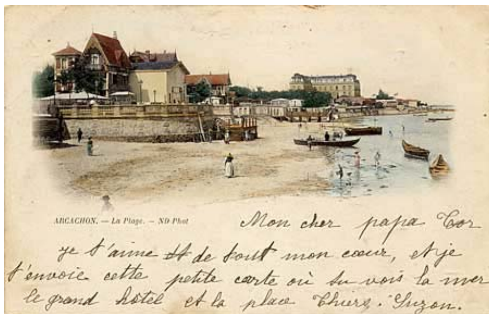
Type 4 : type 2 numérotée