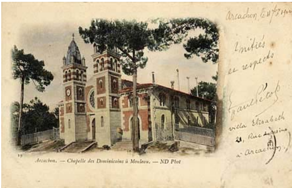
Type 6 : grand nuage numéroté noir et blanc signé Collections ND Phot