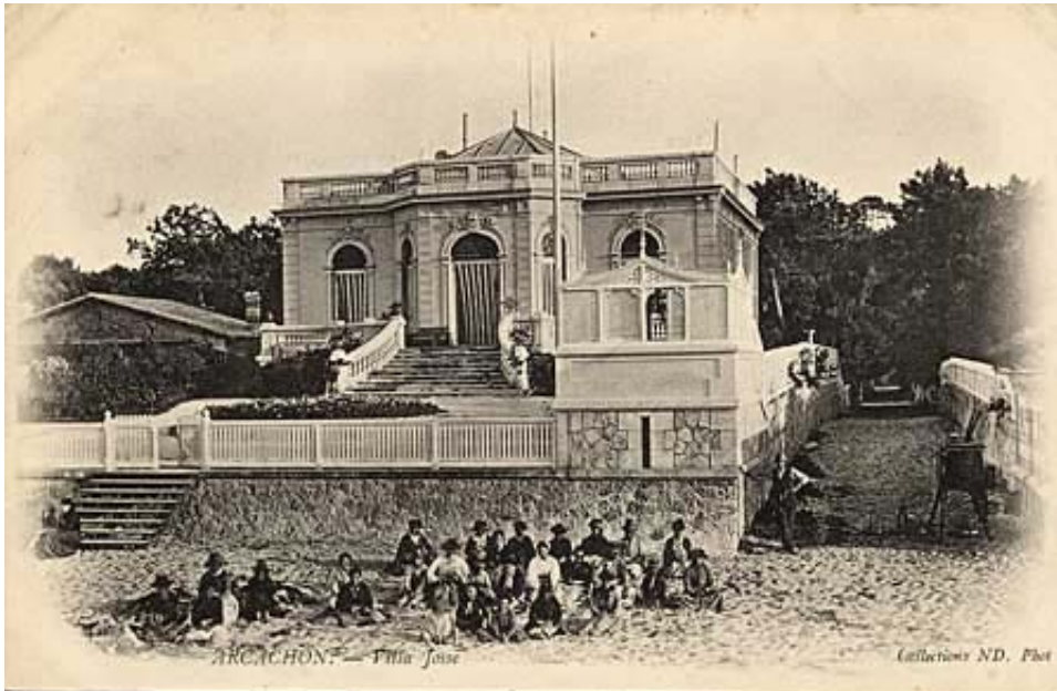
Type 7 : Type 6 en couleur