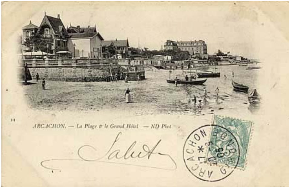
Type 5 : type 4 en couleur